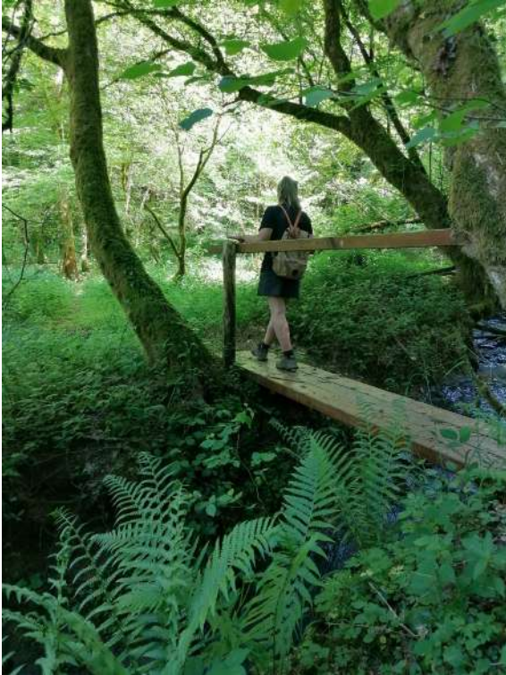
Passerelle sur le chemin