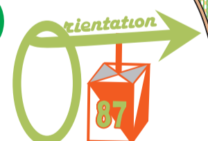
Codes des balises pour correction