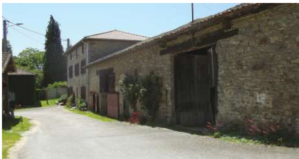
Vieilles granges à la Mazière