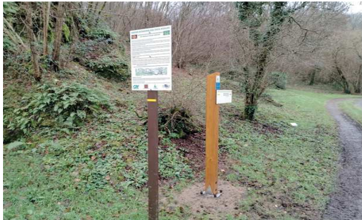
Le sentier botanique au Moulin de Rancon

Cette topofiche est élaborée et financée par le Conseil départemental de la Haute-Vienne dans le cadre de sa politique en faveur de la randonnée.