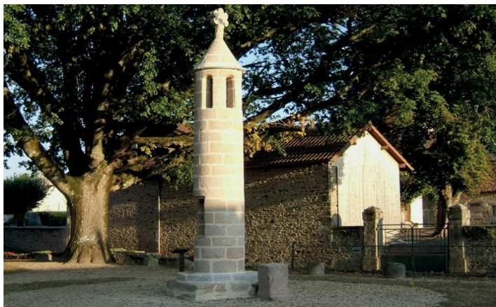
La lanterne des morts de Rancon

Il a été identifié 23 arbres (conifères et feuillus), 12 arbustes, 16 plantes soit 51 végétaux différents. Ceux-ci sont présentés par des petits panneaux tout le long du sentier. Un petit guide est disponible à la mairie de Rancon. De plus un QR code se trouvant sur ces panneaux permet d'avoir accès directement, à partir de son téléphone mobile, à la fiche spécifique de chaque végétal. Quatre panneaux d'interprétation des milieux forestiers ont aussi été mis en place pour approfondir les connaissances sur les arbres et la forêt en France.