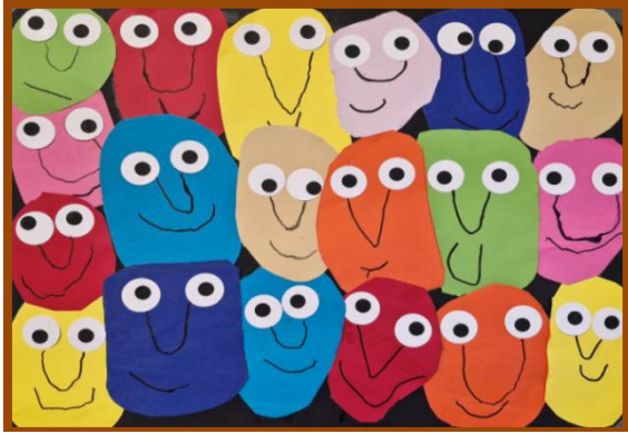
Classe de Moyenne Section