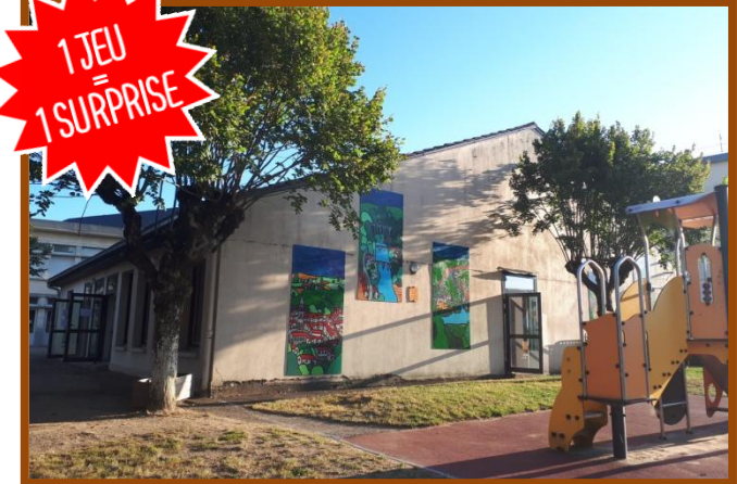
Ecole maternelle George Sand

Les élèves de l'école maternelle George Sand ont créé un parcours d'interprétation en 10 étapes dans le centre-ville de Saint-Léonard-de-Noblat. Chaque étape est matérialisée par un bac de plantation qui accueille une réalisation en porcelaine et un texte explicatif. Un petit exercice physique et ludique est proposé afin que chacun puisse pratiquer une activité tout en s'amusant.