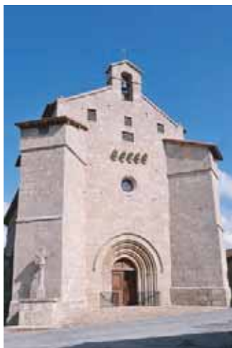
Eglise fortifiée de Blond

Le plan primitif, simple mais de dimensions vastes, comportait une abside semi-circulaire, raccordée à une nef rectangulaire. Les chapelles furent ensuite accolées. En élévation, l'édifice présentait seulement deux étages, marqués par deux corniches, avec un clocher, certainement plus important que tout autre clocher-mur comme le laisse imaginer l'écho légendaire de