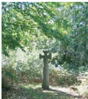
Croix des "septs fayauds"

Un groupe d'arbres est baptisé "les sept fayauds". De là, selon la légende, les Anglais, au cours de la Guerre de Cent Ans, tiraient au canon sur le château de La Barde, aujourd'hui disparu. A trente pas de là se trouve une croix en pierre, taillée dans la masse ou dans un menhir. Elle aurait été érigée sur la tombe d'un soldat mort pendant la Guerre de Cent Ans.