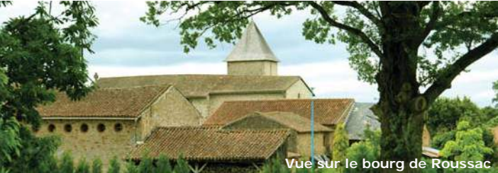
Vue sur le bourg de Roussac