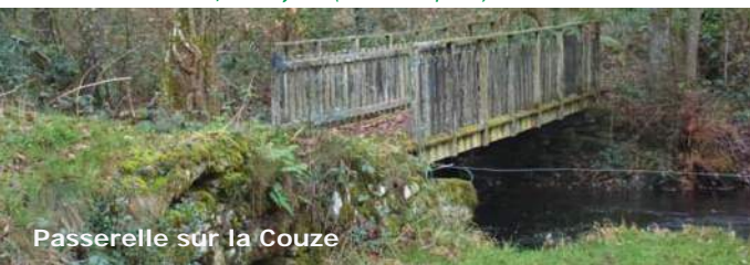
Passerelle sur la Couze

La fontaine Saint-Martial s'accompagne d'un lavoir. Une de ses vertus était de guérir le bétail. Une procession se déroulait chaque année pour la Saint-Martial, le 30 juin. (source Wikipédia)