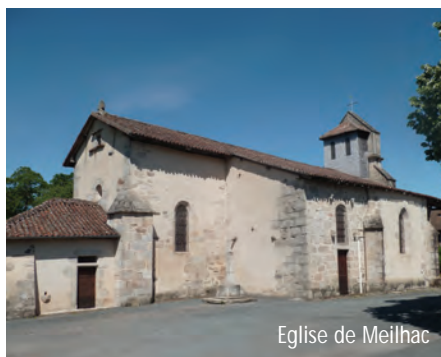
Eglise de Meilhac