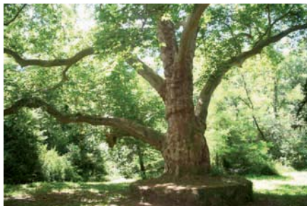
Platanes majestueux âgés de plus de 250 ans au site de Peyrassoulat.