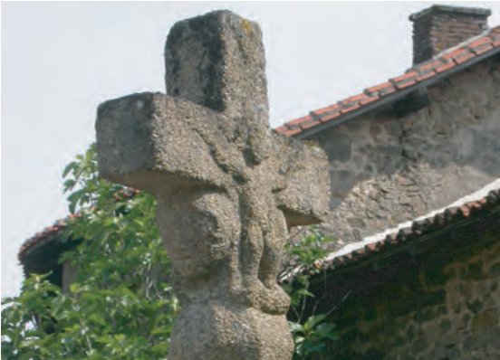
Photo : la croix de Roussis